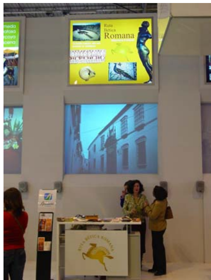
El stand de Ruta Bética en Fitur 05.

Pedro Preciado nos entrevista en Localia para conocer los nuevos proyectos de la Ruta Bética Romana. Igualmente Canal Sur TV, en el noticiario de la 2,30 del día 26 de enero aparece el Stand de la Ruta Bética Romana en Fitur05.