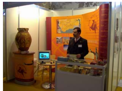
Stand de Ruta Bética Romana en las Atarazanas de Sevilla

Los representantes de Ruta Bética Romana asisten a la II Feria de Turismo Cultural celebrada en Málaga en el palacio de Exposiciones y Congresos.