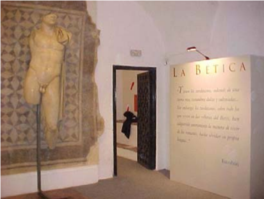
Montaje de la Exposición la Vía Augusta en el Museo de la ciudad de Carmona

El Día 16 asistimos a la presentación del Plan de Marketing de la Consejería de Turismo, Comercio y Deporte en la Delegación del Gobierno de Andalucía. La televisión autonómica CanalSur2 nos entrevista con motivo del montaje de la exposición en la Alcazaba de Almería, para conocer la repercusión de la exposición en los diferentes municipios.