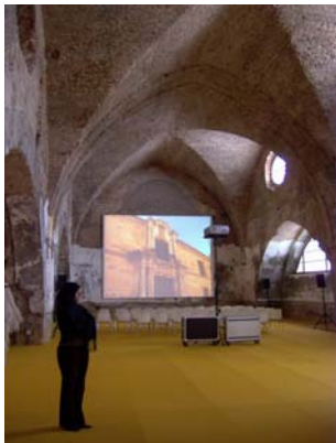
Atarazanas. Proyección de documentales de los municipios de la Ruta Bética Romana.

Dentro del Proyecto Delta, organizado por la Consejería de Cultura de la Junta de Andalucía y en las Atarazanas de Sevilla, la Ruta Bética Romana cuenta con un stand dentro del Forum-Exposition des Systèmes Cultures Territoriaux, à Séville. La Muestra estuvo abierta todos los días en las Reales Atarazanas de Sevilla los días 24 25 y 26 de octubre y durante ella tuvimos una exposición de nuestro proyecto a todos los socios europeos.