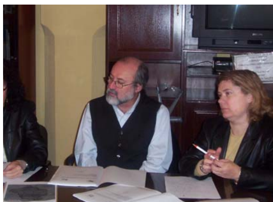
Junta General de Accionistas. Ruta Bética Romana

El día 29 se reúnen en Carmona en el Alcázar de la Puerta de Sevilla, el Consejo de Administración y la Junta General de Accionistas de la Ruta Bética Romana.