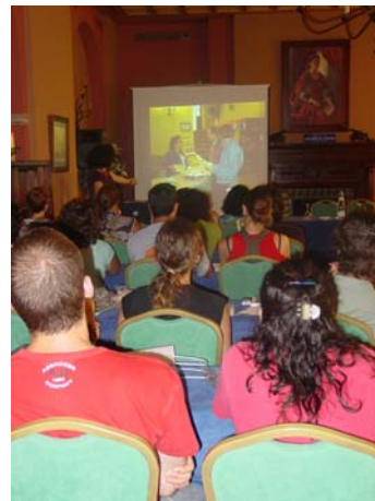
Curso de verano Planificación y creación de productos turísticos culturales

El programa Tesis en la Universidad, nos dedica unos minutos en CanalSur 2 para conocer el proyecto de la Ruta Bética Romana.