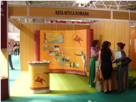
Stand de Ruta Bética en Feria Jaén.

El día 14, la Universidad de Alicante y la CAAM invitan a la Ruta Bética Romana en su sede de Orihuela a dar la conferencia “la Ruta Bética Romana, producto cultural y turístico”, con gran asistencia de público y personal especializado.