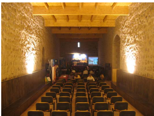
Jornadas de difusión de proyectos turísticos en el Castillo de Alcaudete

El Día 12 los alumnos de la Asociación de Gestores del Patrimonio Histórico de la Fundación Carolina con sede en Madrid, se desplazan desde Madrid, para conocer el proyecto de Ruta Bética Romana.