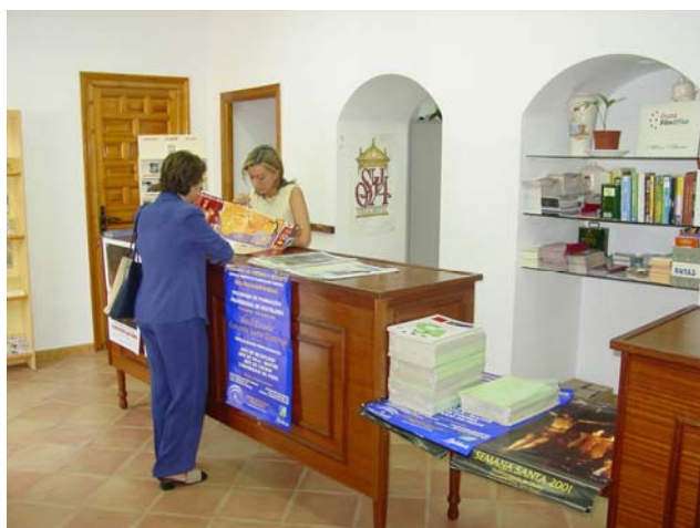
Loa materiales en la Oficina de Turismo de Osuna

La guía de la Ruta Bética Romana y todo el material realizado dentro del Convenio de Turismo Andaluza, se encuentra distribuida en todas la oficinas de Turismo Andaluz, en las oficinas y museos municipales de la ruta.